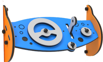
PANNELLO LUDICO X1